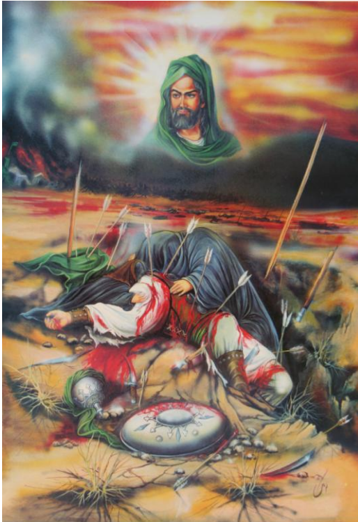
Das Ende der Schlacht von Kerbela: die Frauen beweinen al-Husayns Leichnam, er selbst blickt entrückt aus dem Himmel herab (volkstümliche Darstellung auf einem iranischen Poster)

Die Ereignisse der Schlacht von Kerbela 14 wurden später in unzähligen Details legendenhaft ausgeschmückt, der 10. Muharram ist der höchste Feier- bzw. Gedenktag der Schiiten und das Grab al-Husayns in Kerbela der schiitische Pilgerort schlechthin. Da der schiitische Islam religiösen Bildern weniger skeptisch gegenübersteht als dies im sunnitischen Bereich der Fall ist, kann man heute in vielen schiitisch dominierten Regionen Poster kaufen, welche die Schlacht sehr drastisch darstellen. Auch die bildliche Darstellung von 'Ali und anderen Mitgliedern der Ahl al-Bayt (in früherer Zeit sogar des Propheten selbst) ist weitverbreitet und wird auch von Rechtsgelehrten meist nicht als Problem gesehen.