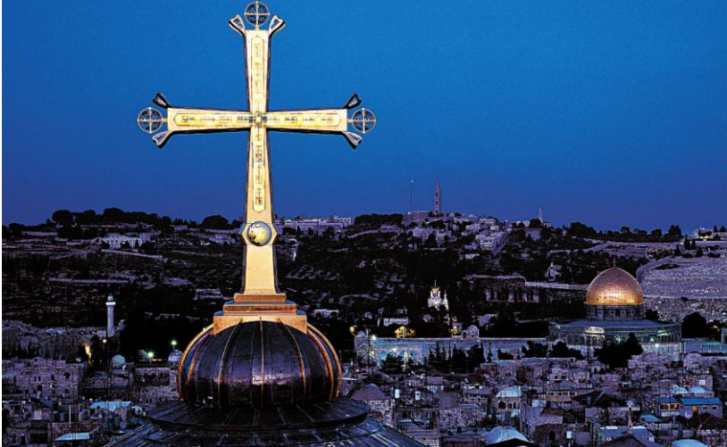
Golgothakreuz, Grabeskirche Jerusalem

Zwar steht der Nahe Osten nahezu täglich im Blickpunkt medialer Berichterstattung, dennoch wird das Christentum dieser Region kontinuierlich ausgeblendet. Es sind der Nahost-Konflikt, Israel-Palästina, der Irak oder das Regime in Teheran, die die Aufmerksamkeit auf sich ziehen und die politisch-religiöse Debatte auf den Islam und das Judentum reduzieren. Dabei darf nicht vergessen werden, dass die Wiege des Christentums im Nahen Osten steht, dass sich die Christen der Region nicht nur immer als wesentlicher Bestandteil der Region verstanden haben sondern diese Region auch schon lange vor dem historischen Auftreten des Islam geprägt haben. Auch heute üben sie in den Ländern des Nahen Ostens wichtige gesellschaftliche Funktionen aus, mitunter sogar eine vermittelnde Rolle zwischen rivalisierenden muslimischen Gruppierungen.