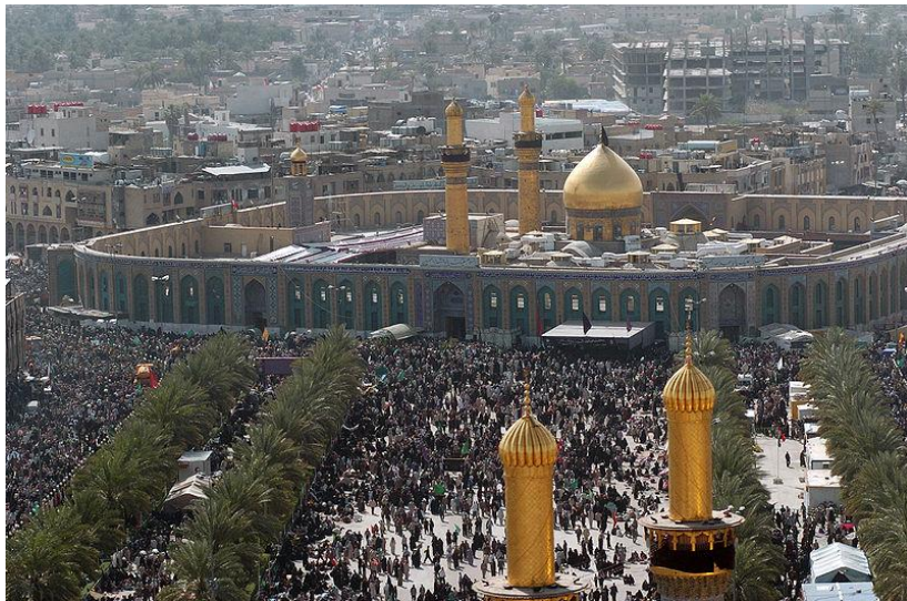
Hussein-Moschee in Kerbela

Zunächst weise ich darauf hin, dass im folgenden Text, wo immer von Schia, Schiiten, schiitisch etc. die Rede ist, so gut wie ausschließlich die Zwölferschia gemeint ist. Es handelt sich um die zahlenmäßig eindeutig stärkste, geographisch am weitesten verbreitete und gegenwärtig in religiös-politischer Hinsicht aktivste Fraktion innerhalb der Schia. Sie ist auch unter Bezeichnungen wie Imâmîya oder Ja'fariya bekannt. Die Berücksichtigung anderer Gruppen wie der Zaidîya oder Ismâ'ilîya und die Beschreibung ihres Verhältnisses zur Zwölferschia würde den Rahmen des vorliegenden Beitrags sprengen.