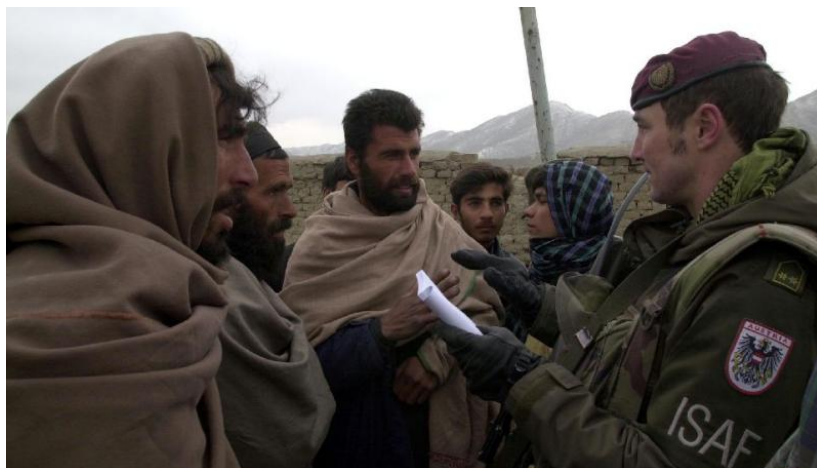
International Security Assistance Force, Afghanistan, Foto: Österreichisches Bundesheer

There was a time during the 1970s and 80s that it was possible to have peaceful, relaxed and mutually confirming and generally optimistic meetings of Christians and Muslims in various parts of Europe and even across the Mediterranean. The events of 11 September 2001 tend to be cited as the moment when reality caught up with us. The scenario quickly both absorbed existing political processes, such as the Palestine question and tensions in the Caucasus, and fed into the by now well-known new ones: the so-called 'war on terror' and the US-led actions in Afghanistan and Iraq. But if our view is restricted to perspectives imposed by crisis management in the context of such events, I would argue that the long-term possibilities of creating constructive relations internationally risk being held hostage for short-term gain, gain which may not even be realized.