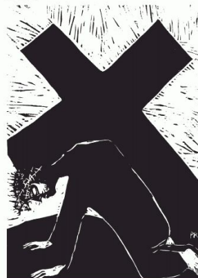
III Jesus fällt zum ersten Mal