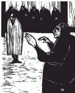
I Zum Tode verurteilt