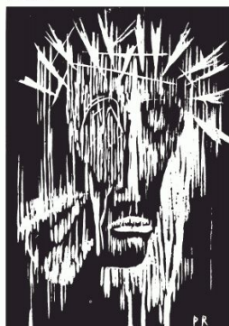
VI Veronika hilft