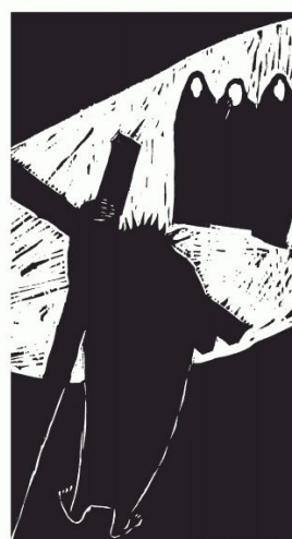
VIII Jesus begegnet den Frauen