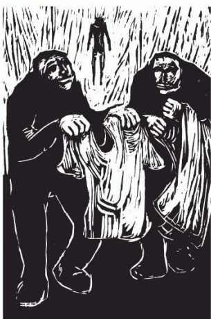
IX Jesus wird seiner Kleider beraubt