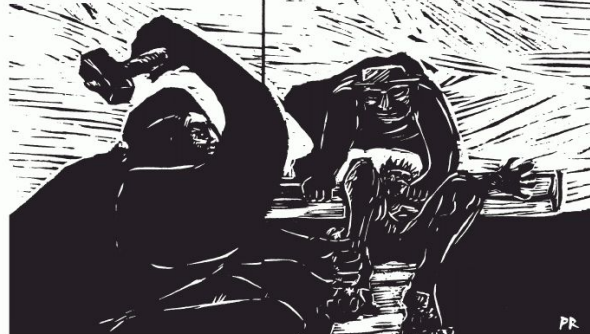
X Jesus wird ans Kreuz genagelt