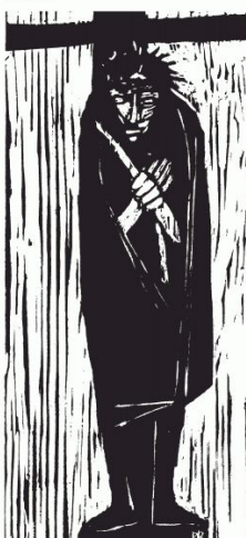
II Ein Kreuz für Jesus