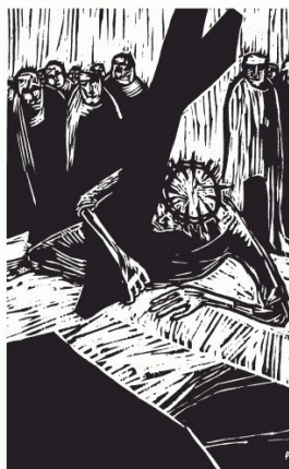
VII Der zweite Fall Jesu