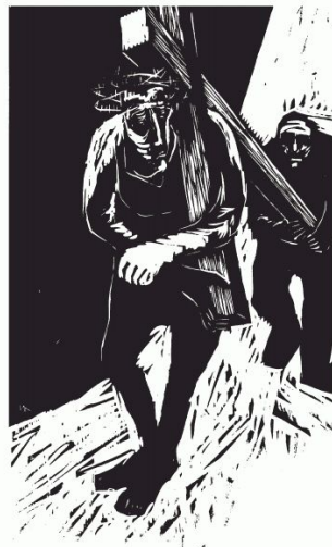
V Simon hilft