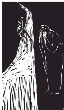
IV Jesus begegnet seiner Mutter